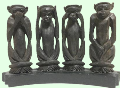
タンザニアの三猿 (吹田市立博物館蔵)